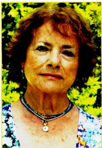
Από την Συγγραφέα Ελένη Σαραντίτη

Ο Ιωάννης Παλαιολόγος -ο μεγάλος αδελφός του Κωνσταντίνου- στην πομπή των Μάγων, όπως ονόμασε την τοιχογραφία του ο Benozzo Gozzoli στο παρεκκλήσι των Μεδίκων στην Φλωρεντία. (Φώτο 2).