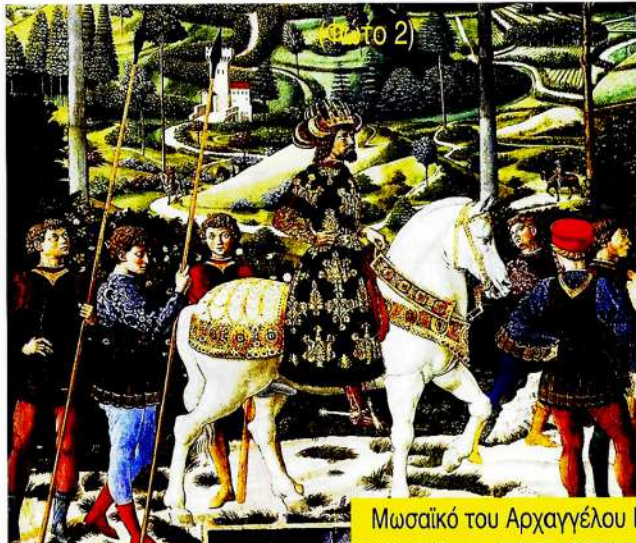
Μωσαϊκό του Αρχαγγέλου Γαβριήλ